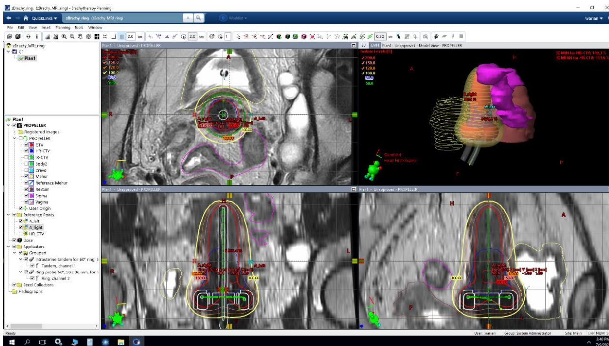
Рис.1 Пример выполненного плана лечения рака шейки матки